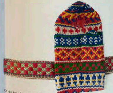
En vävt band kunde inspirera till en mönsterbård på en stickad vante. Káidejuvvon girjje ládde girjji goddajuovvon váhcci.