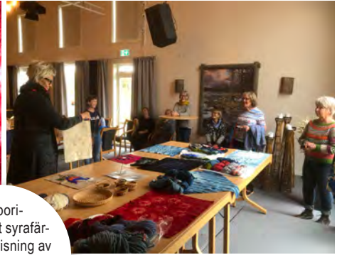
Shibori-mönstrat syrafärgat tyg, visning av allt som gjorts under helgen, rotslöjdarnas alster.