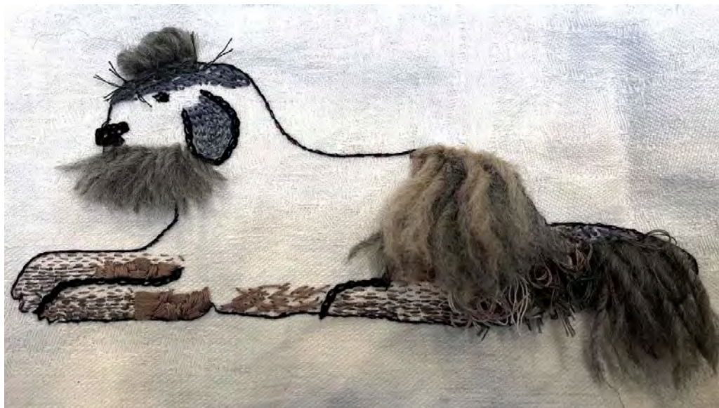
"Nelson", broderi av Britt Vaksjö 2019