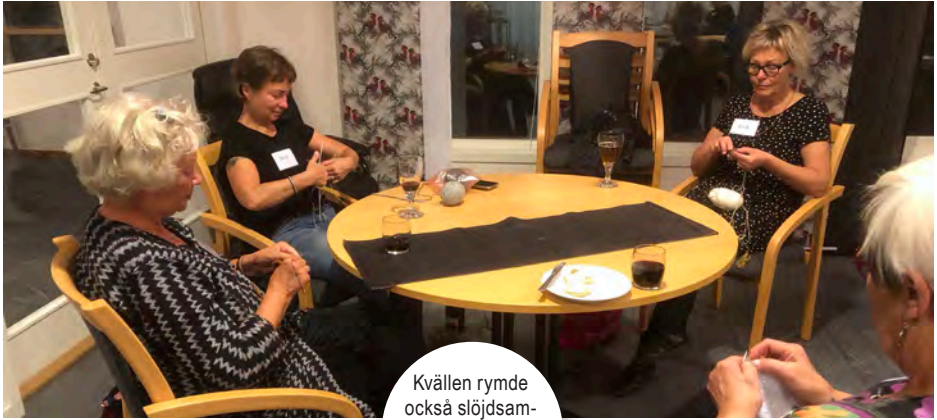
Kvällen rymde också slöjdsamvaro över ett glas vin. Rotslöjd och påsöm.