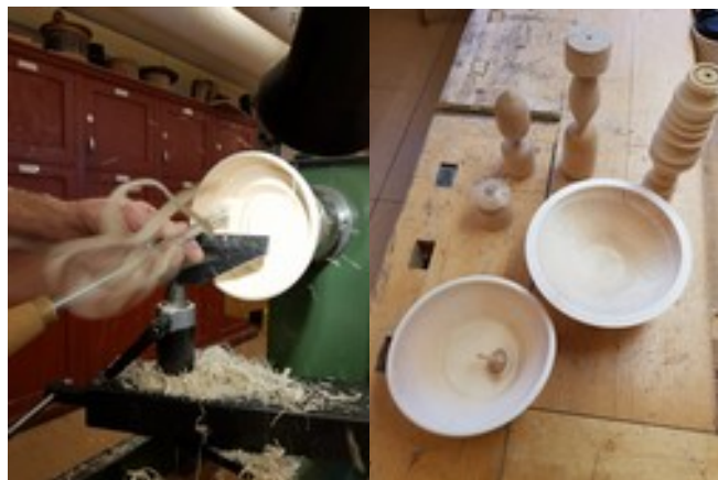
Några alster från svarvkursen

Trästycke som blir skål Under helgen 8-10 mars genomförde Åke Landström en kurs för 6 deltagare på Västerbergs folkhögskola skola. Efter några trevande försök med inställningar av svarv, fastsättning av träbitar och användning av skärverktygen kunde vi stolt visa upp både ägg, snurror och ett par skålar. / Muriel