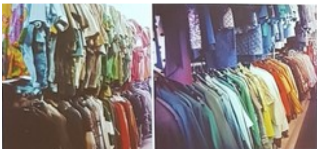
Kläder i färgskala och skor i långa rader

Vi fick också inblick i hennes fantastiska garderober. Här kan man prata om "walk in closet".