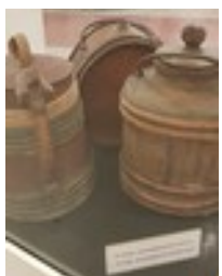
Nya ölburkar och äldre ölkaggar